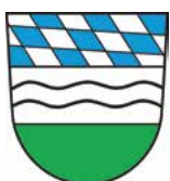
Furth im Wald

Ausblick: Ab 2021 arbeiten wir gemeinsam mit dem tschechischen Bündnis Domažlicko an der Vorbereitung für die neue EU-Förderperiode 2021 – 2027.