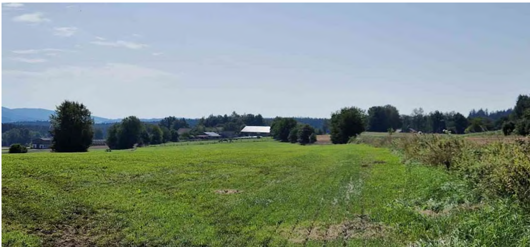
Abb. 6: Blickrichtung Süden – Grünland

Aus artenschutzrechtlicher Sicht spricht somit nichts gegen das geplante Vorhaben.