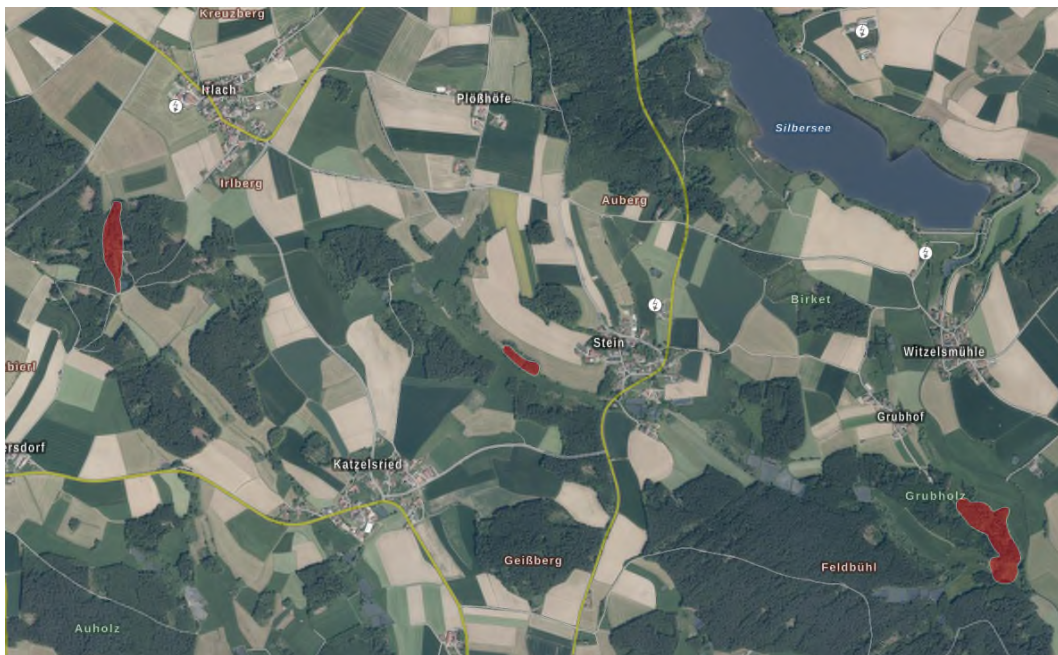
Abb. 3: Luftaufnahme – Bodendenkmäler (rot)