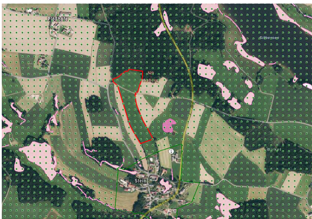
Abb. 4: Biotope (rosa), Landschaftsschutzgebiet (grün gepunktet), Planungsgebiet (rot)

Der Ortsbereich von Stein ist vom Landschaftsschutzgebiet ausgenommen.