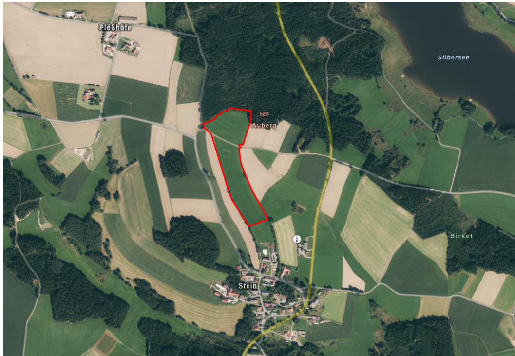
Abb. 1 – Luftaufnahme – Planungsgebiet (rot)

In der Gemeinde Tiefenbach im OT Stein soll am nördlichen Ortsrand durch den vorhabenbezogenen Bebauungsplan „Solarpark Stein“ eine Freiflächenphotovoltaikanlage errichtet werden. Art und Umfang der Bebauung und Erschließung werden in der Begründung zum vorhabenbezogenen Bebauungsplan behandelt.